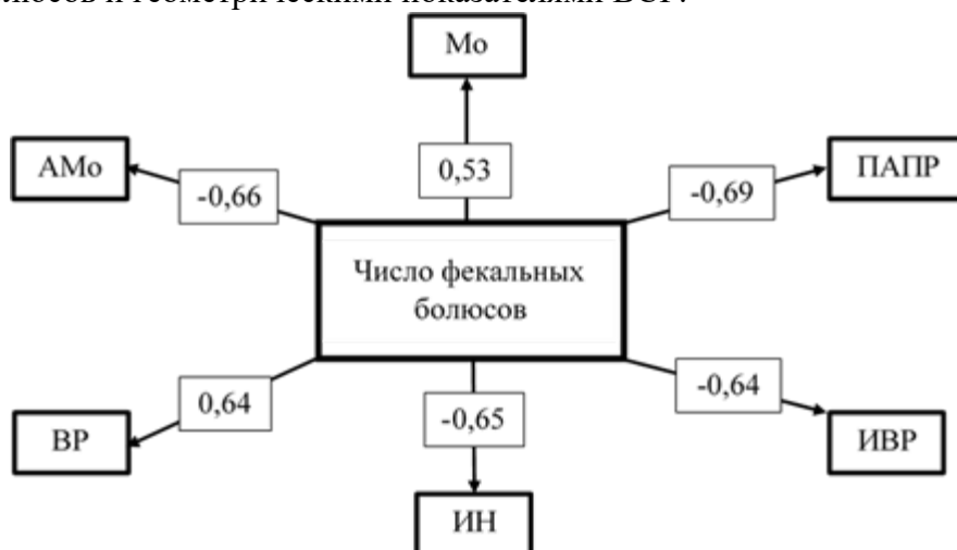
Рисунок 2 – Корреляция показателей ВСП и поведения в открытом поле у самок крыс Вистар

На рисунке 2 представлены корреляционные связи в тесте открытое поле между числом фекальных болюсов и геометрическими показателями ВСП.