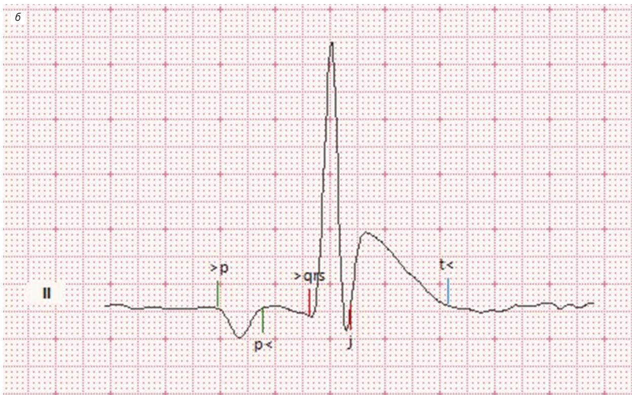
Рис. 3. Электрокардиограмма. Отрицательный зубец P: а – грудные отведения, 75 мм/с, 40 мм/мВ, фильтр изолинии, 75 Гц; б – II отведение, 400 мм/с, 80 мм/мВ